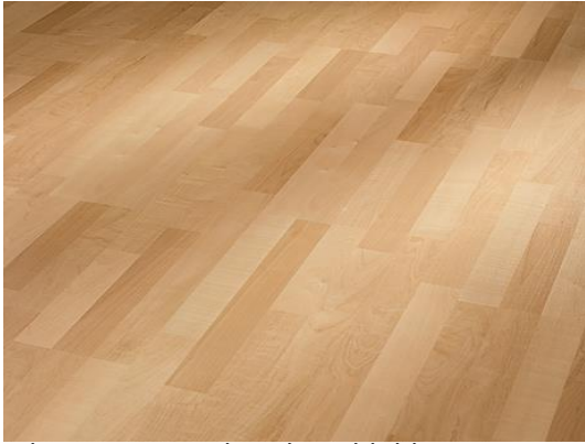
Ahorn 202 3-Stab Holznachbildung