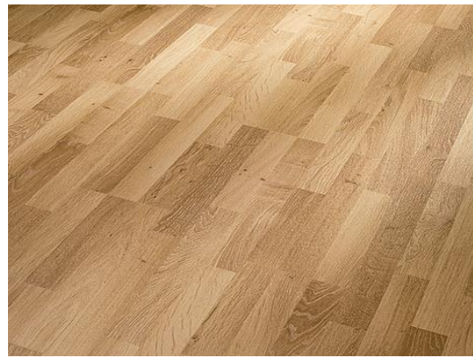
Eiche 462 3-Stab Holznachbildung