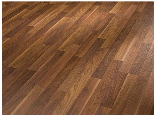
Nussbaum 411 3-Stab Holznachbildung