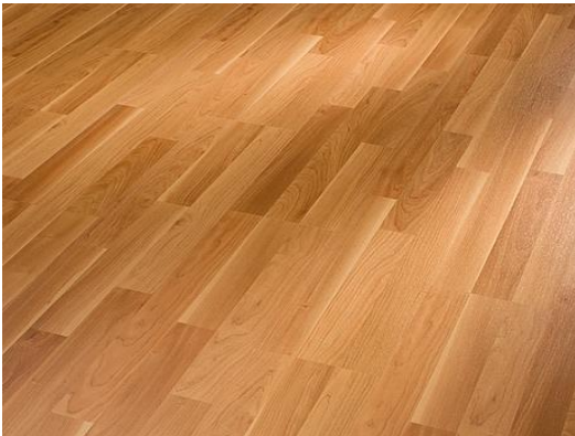
Kirsche 457 3-Stab Holznachbildung