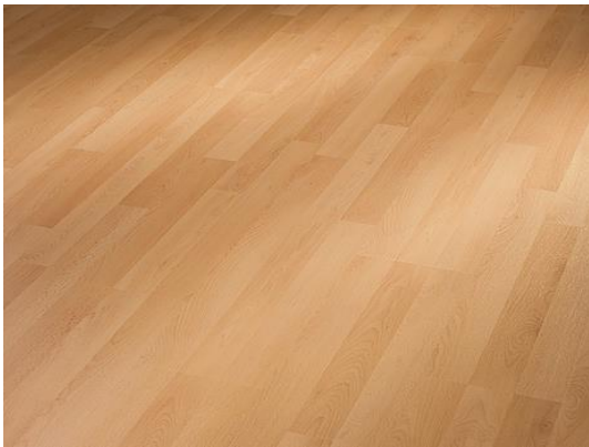
Buche 6201 3-Stab Holznachbildung

| In Elementen mit Deckmaß: 1288 × 198 mm