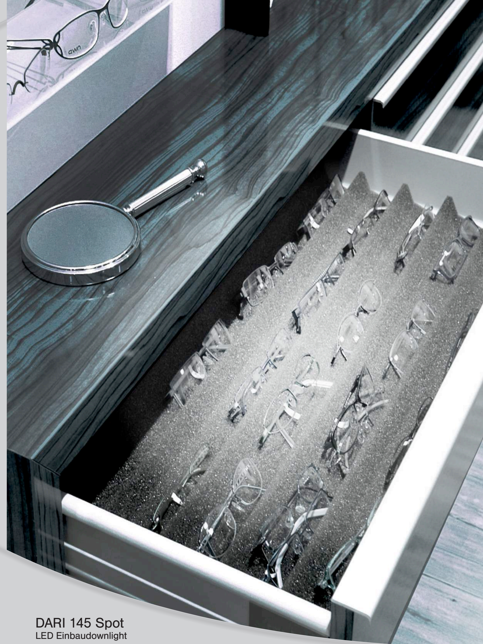
DARI 145 Spot LED Einbaudownlight